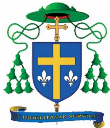
Ⓜ Biskupský znak s heslem V pokoře sloužit