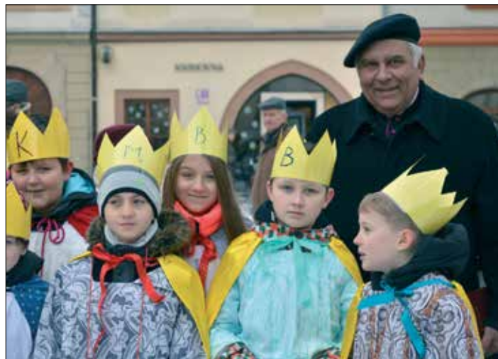
☛ Pardubice 2019, rozeslání tříkrálových koledníků

Otec biskup Karel nás ale dovedl i povzbudit. Vzpomínám, jak nás jednou shromáždil na biskupství v kapli sv. Karla Boromejského, kde nám vyprávěl, jak 30. 4. 1950 na něj biskup Pícha narychlo vložil kříž biskupského svěcení se slovy: „Vás jsem si vybral jako Šimony, abyste mi tento kříž pomohli nést.“ Krátce po své konsekraci šel biskup Karel na 11 let do vězení. Jednou nám taky biskup Karel řekl: „Že jste tlustí, to mi nevaří, ale nesmíte mně tady padat jako plané švestky. Musíte všechno vydržet!“