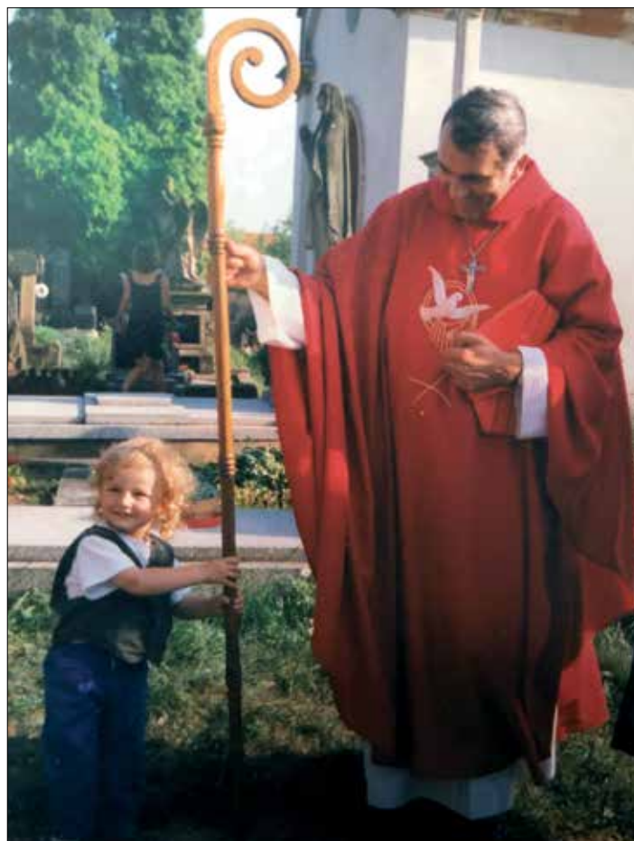
◀ Biskupské insignie jsou vždy středem pozornosti dětí